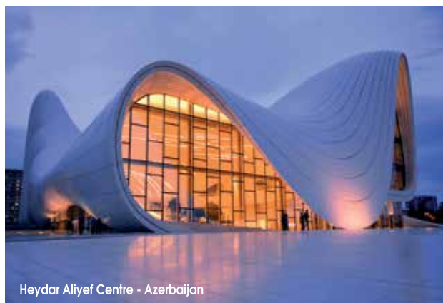
Heydar Aliyev Centre - Azerbaijan

Stupefacenti, originali, a volte solo bizzarre, queste costruzioni non passano decisamente inosservate. Scaturiscono dall'estro e dai disegni di architetti che con coraggio hanno superato gli standard classici e stereotipati della progettazione.