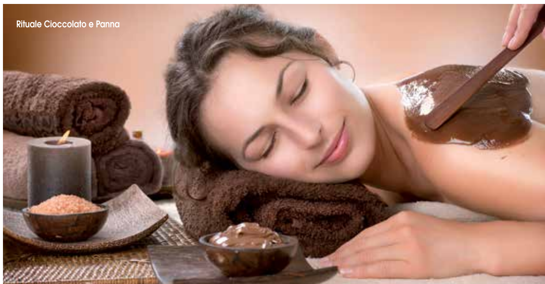
Rituale Cioccolato e Panna