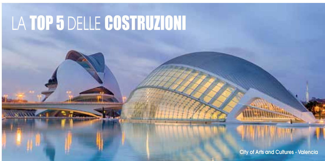
City of Arts and Cultures - Valencia