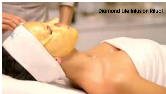
Diamond Life Infusion Ritual

D ai massaggi alla frutta fino a quelli al silicio, passando per l'Ipod Massage: ecco alcuni trattamenti SPA insoliti ed esclusivi.