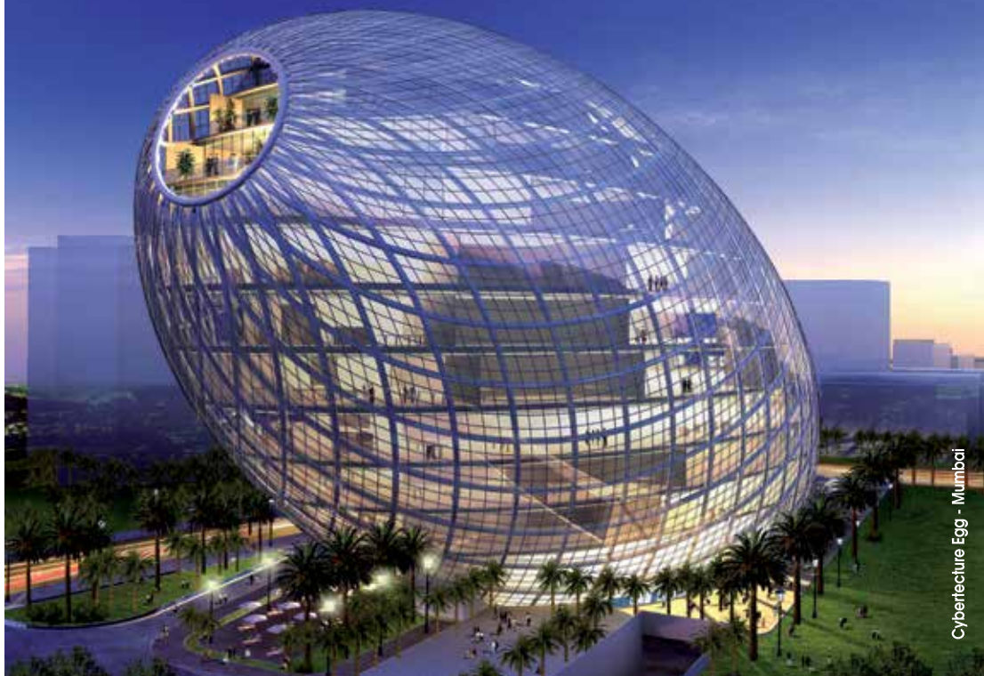
Cyberculture Egg - Mumbai

tiago Calatrava e Felix Candela ed è stato inaugurato il 16 aprile 1998. Il Lotus Building in Cina è opera dello Studio505, ed è costituito da un piano interrato e due piani adibiti a strutture pubbliche (uffici, sale e centro congressuale). L'intero complesso che si trova su un lago artificiale già esistente, è stato completato nel 2013.