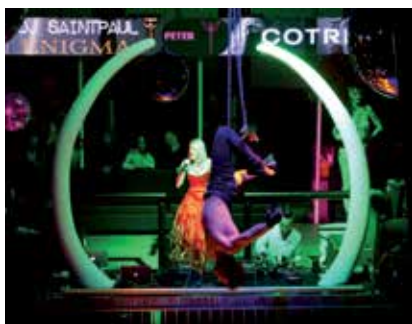
Alcune foto degli spettacoli di intrattenimento della "Serata Enigma" al Peter Pan.