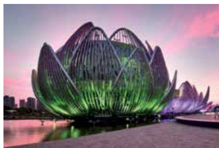
Due immagini del Lotus Building in Cina