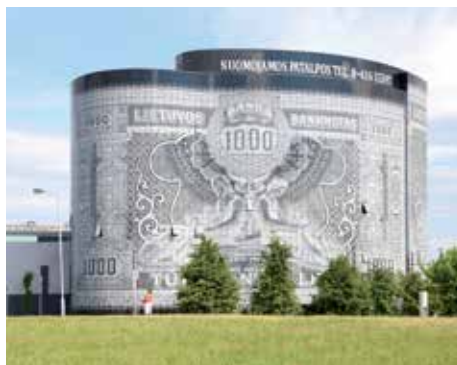
Banknote Building - Kaunas

Si dice che il denaro non "cresce" sugli alberi, ma in Lettonia "cresce" sotto forma di edifici. Il Banknote Building è una luminosa costruzione composta da 10 piani, progettata come una banconota LTL 1000. Inaugurato nel 2008, la sua facciata è composta da 4.500 diversi pezzi di vetro smaltati e disegnati, prodotti in Olanda, uniti come un puzzle gigante.