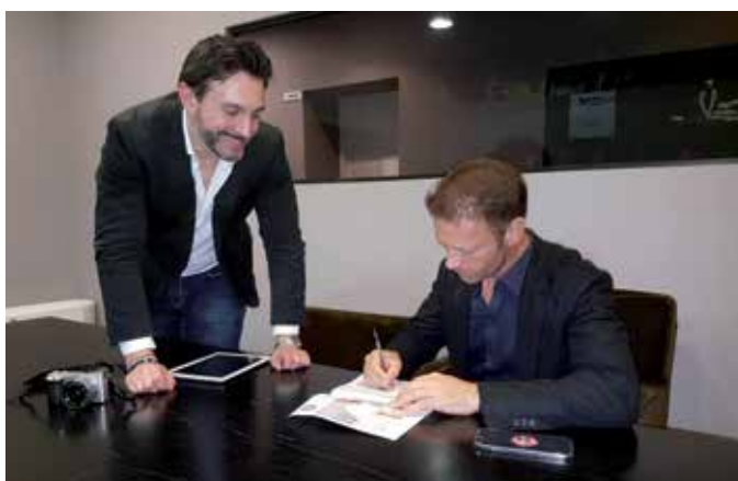
In alto, l'autografo di Rocco Siffredi su TopLook Magazine di Marzo. In basso, l'Editore Massimiliano Pozzi nell'intervista a Rocco Siffredi.